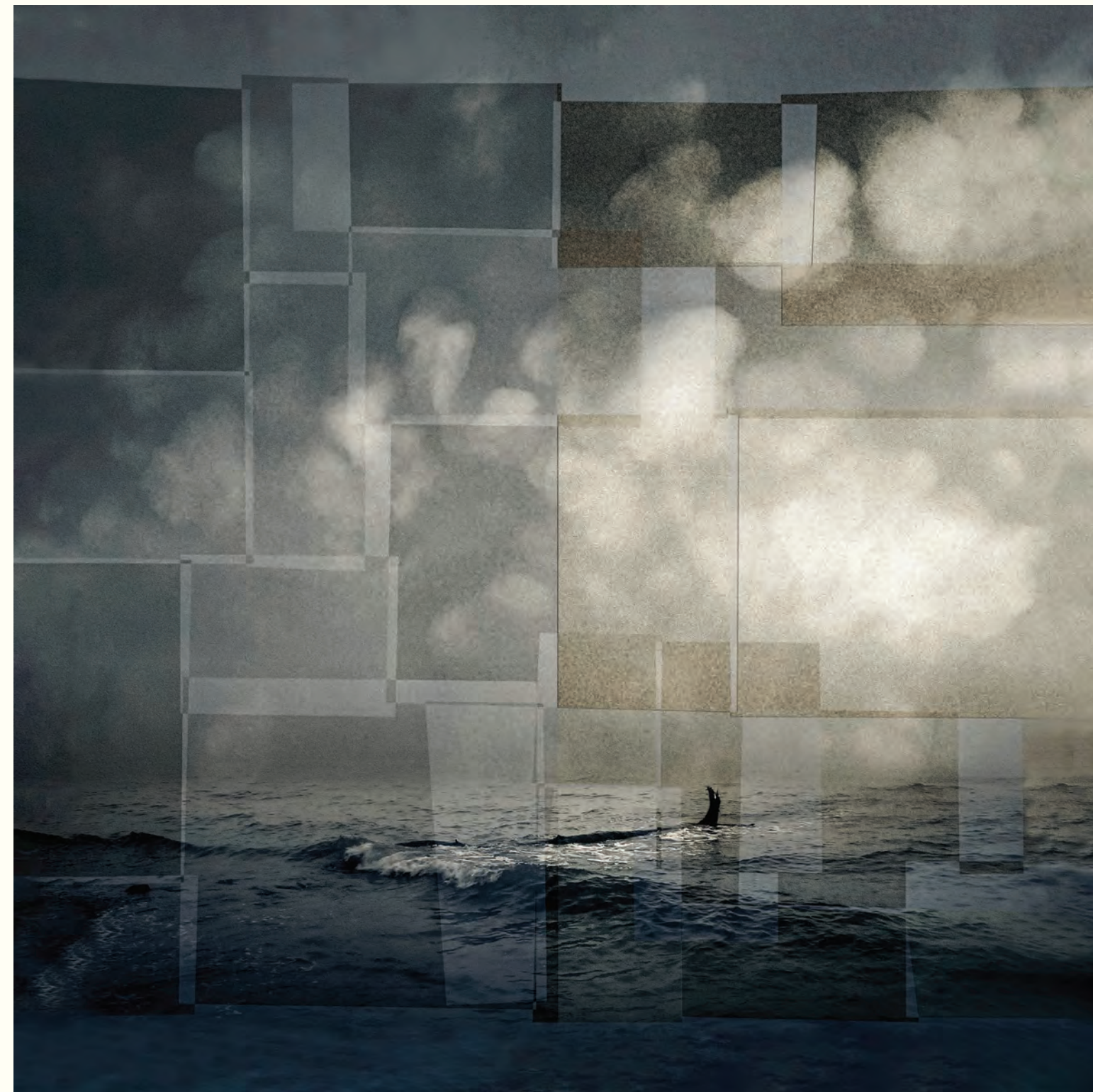
8. Confluencias oníricas más allá del mar Fotografía intervenida digital / Giclee print / 2024 / Lienzografía sobre fine art canvas 100 % algodón / 33.25" X 33.25".