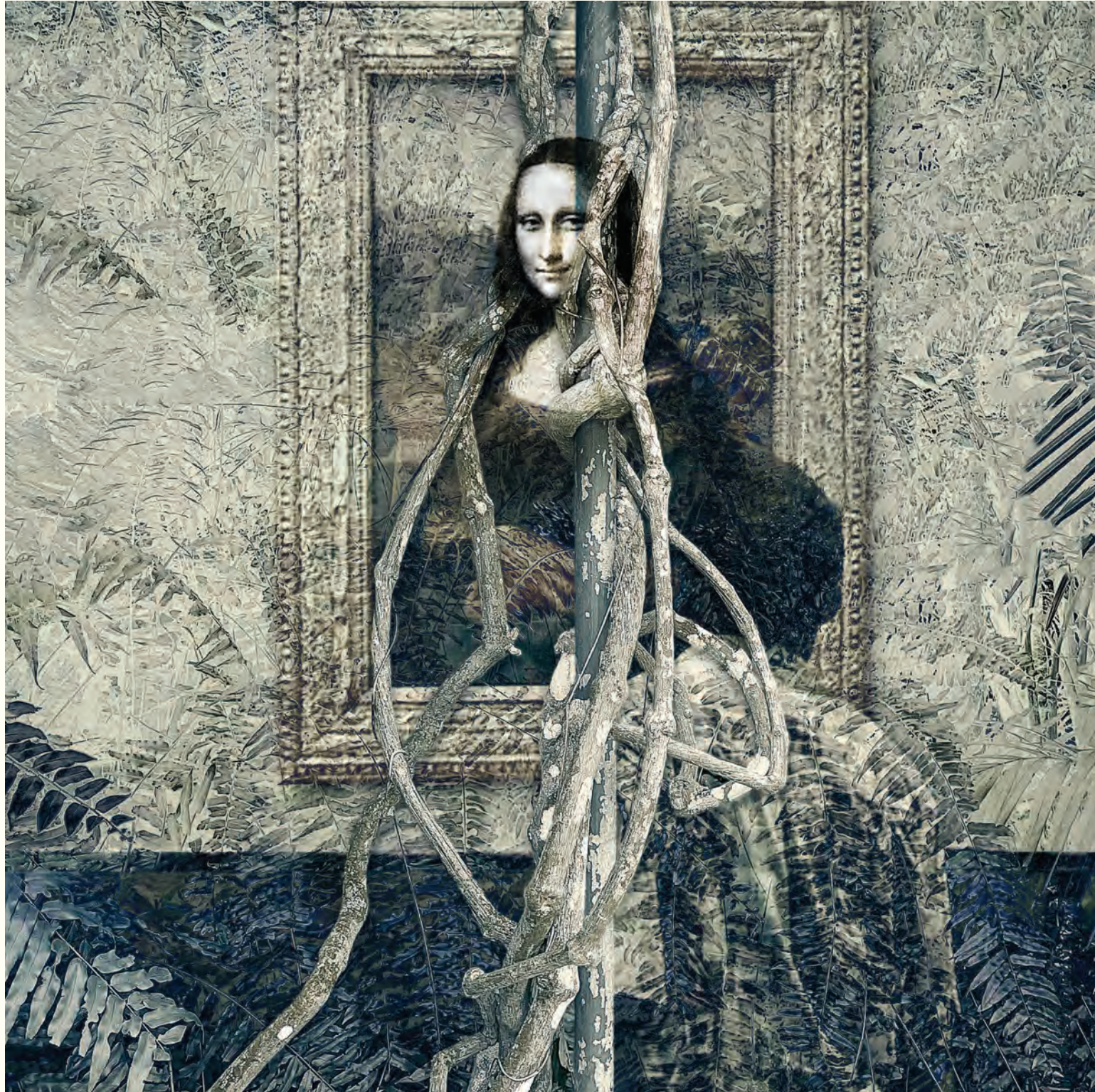
2. Orgánicos lúdicos de mi mente II "La Gioconda", Desde París hasta el Parque Independencia. Fotografía intervenida digital / Giclee print / 2024 / Lienzografía sobre fine art canvas 100 % algodón / 33.25" X 33.25"