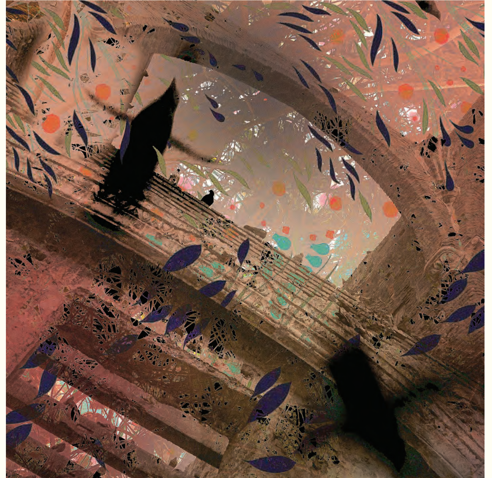
5. Orgánico V / Millones de ojos esperan lo mismo...

Fotografía intervenida digital / Giclee print / 2024 / Lienzografía sobre fine art canvas 100% Algodón / 33.25" X 33.25"