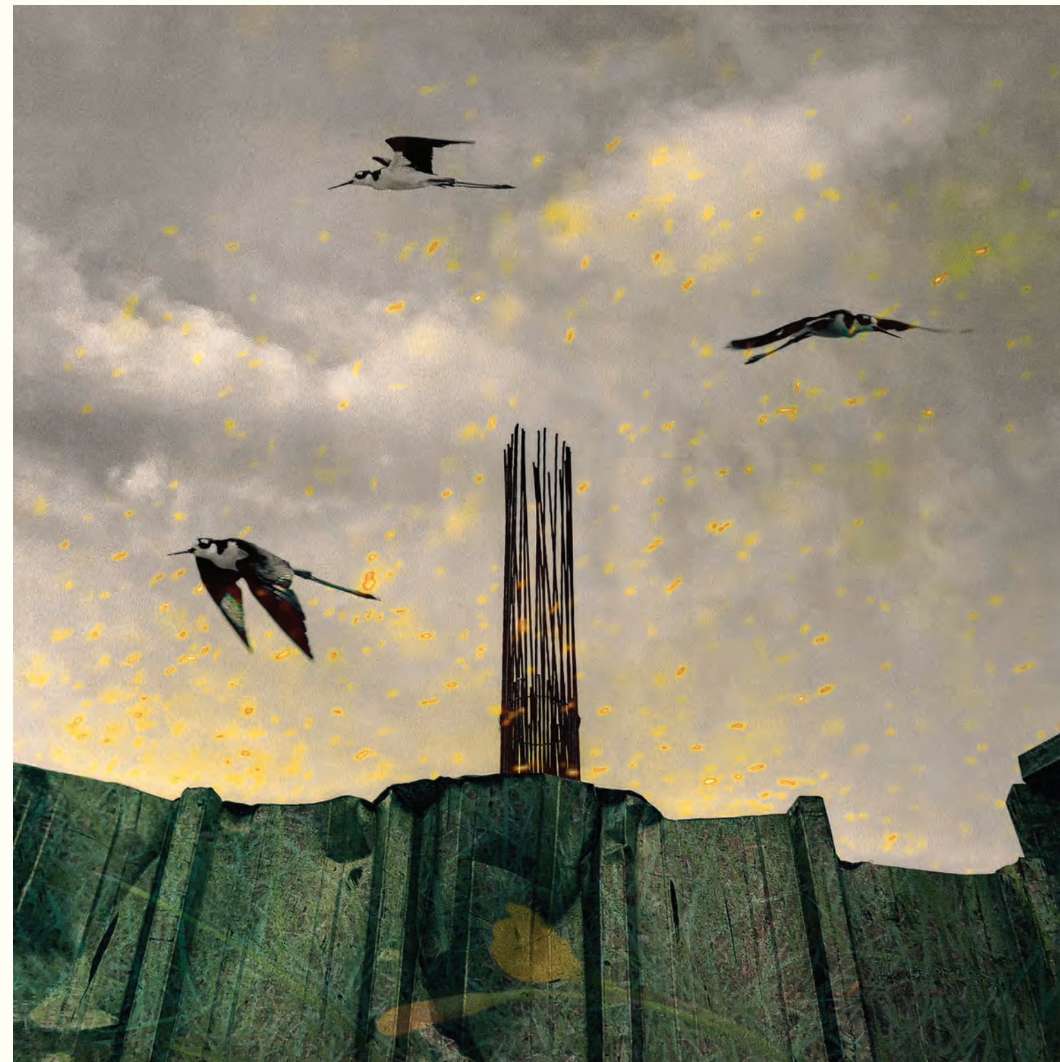
6. The fire of the rose Fotografía intervenida digital / Giclee print / 2024 / Lienzografía sobre fine art canvas / 33.25" X 33.25".

Impacta la mirada del espectador, la forma particular en que Rivera presenta, por ejemplo, Su "Gioconda", una mirada transgresora y subvertida, donde el cuerpo, y la naturaleza se entrelazan de manera compleja y a veces desafiante. Tan desafiante y retador como estudiar la luz de una obra icónica del arte universal y de una época donde la luz es fundamental en la construcción de la imagen. Por ello, en las obras de Rivera el espectador aprecia conscientemente las múltiples capas de significado y la construcción del sentido en la obra de arte. Y, al "seguir el curso del sol", refleja la luz, la historia, la identidad y la memoria fragmentadas; cuestiones siempre presentes en sus obras, pero que, al igual que la luz no son estáticas; mutando, en algunos casos, llegando casi a la abstracción.