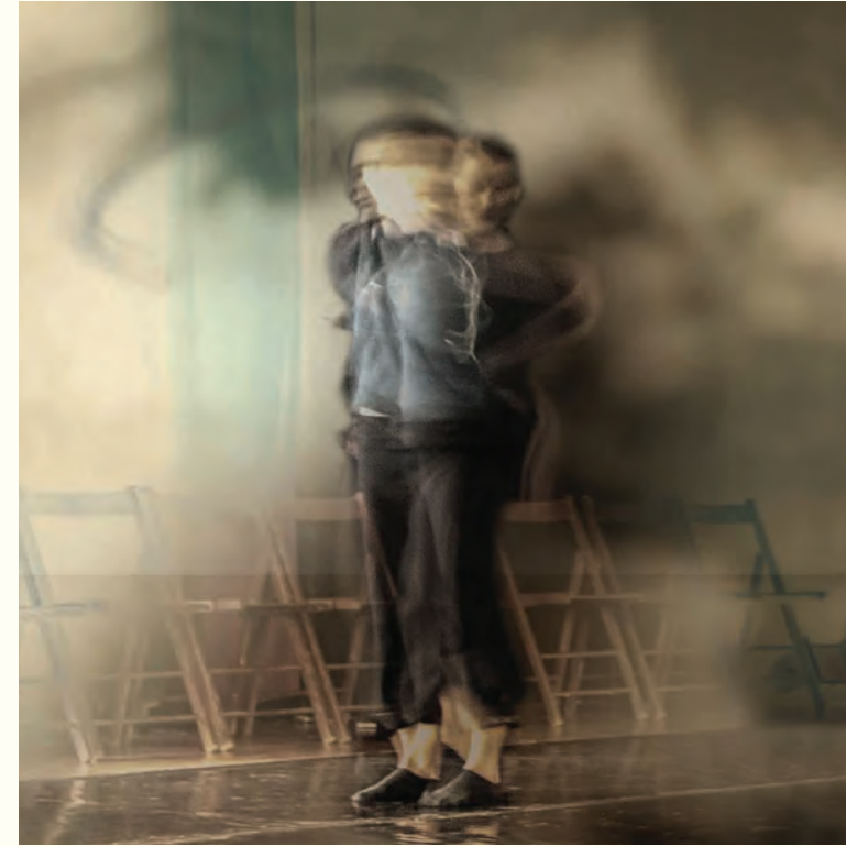
11. Influencias de Bacon. Fotografía intervenida digital / Giclee print / 2024 / Lienzografía sobre fine art canvas / 33.25" X 33.25"