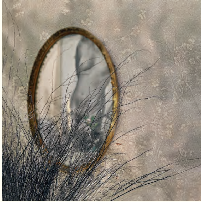
9. Óleo de mujer reflejado entre los barullos del monte. Fotografía intervenida digital / Giclee print / 2024 / Lienzografía sobre fine art canvas / 33.25" X 33.25"