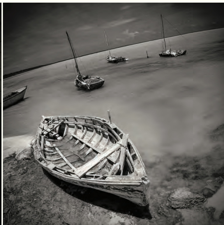
14. Mi curva, mi barca, mi isla. Fotografía intervenida digital / Giclee print / 2024 / Lienzografía sobre fine art canvas / 33.25" X 33.25"

El arte nos ayuda a alterar nuestra percepción del mundo y a replantearnos nuestra jerarquía de valores. Aunque esto es sustancial en cualquier época, lo es más aún en un período de crisis sistémica como el que no ha tocado vivir. Una de las dificultades del arte actual consiste en que la experiencia estética a menudo nace cooptada. –Obligar a alguien a que piense de una manera determinada– Para ser efectiva, hoy más que nunca, cualquier acción artística ha de generar ámbitos de consenso y favorecer la movilización de la gente anónima. Un arte excesivamente útil, que abogue por la unión, corre el riesgo de convertirse en un nuevo idealismo o en una simple excusa para abrir y, de paso, cancelar cualquier probabilidad de ruptura.