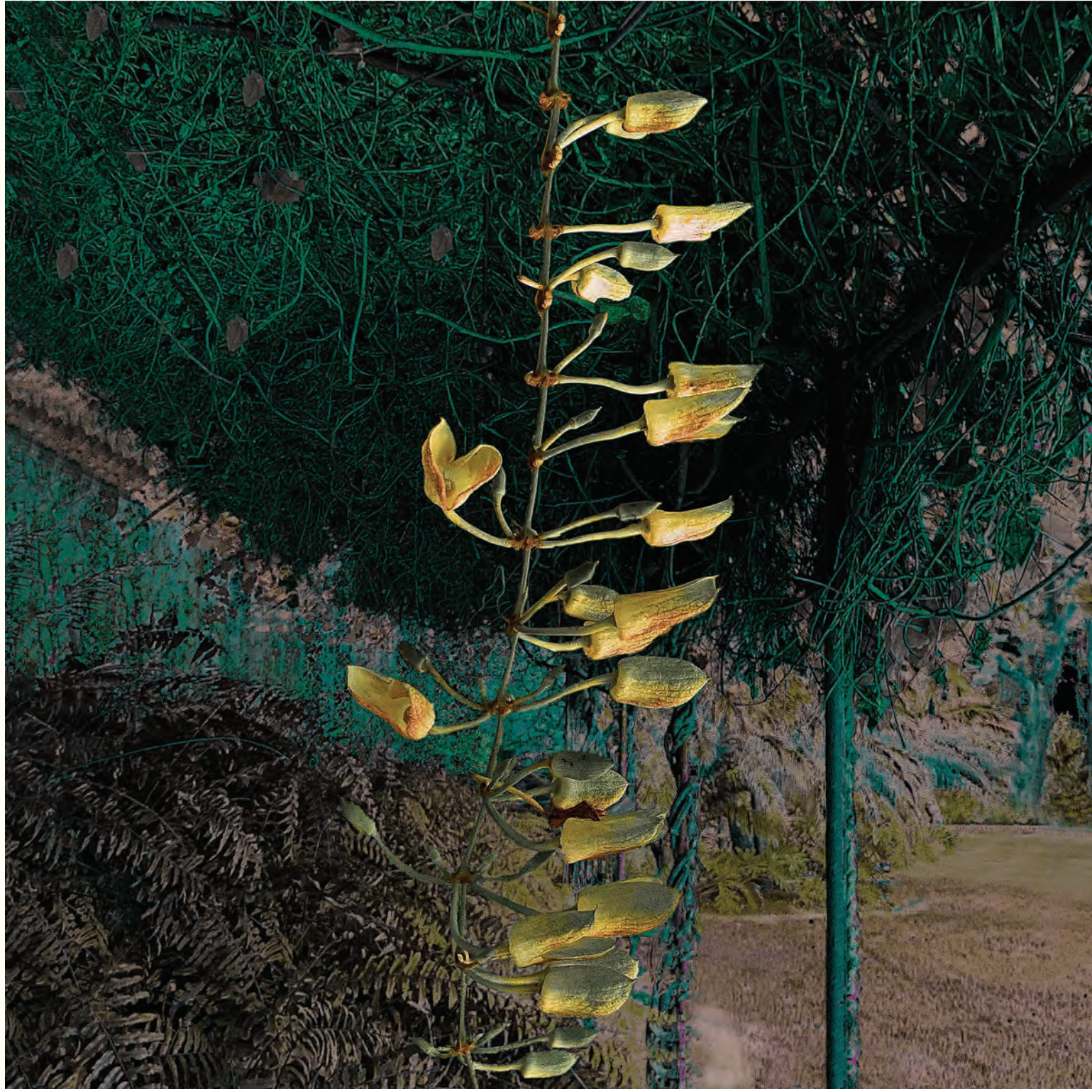
4. Orgánicos lúdicos de mi mente IV

Fotografía intervenida digital / Giclee print / 2024 / Lienzografía sobre fine art canvas 100% Algodón / 33.25" X 33.25"