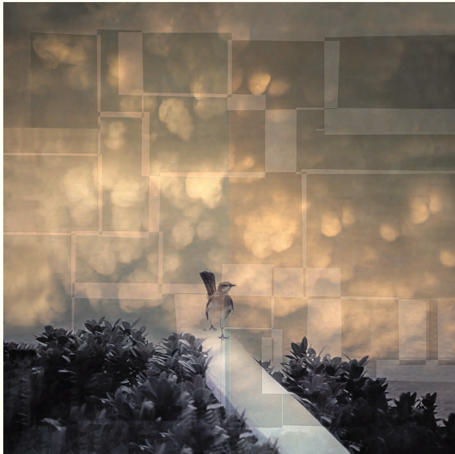
7. Solista, que canta, camina y vuela por barandas marinas. Fotografía intervenida digital / Giclee print / 2024 / Lienzografía sobre fine art canvas 100 % algodón / 33.25" X 33.25".