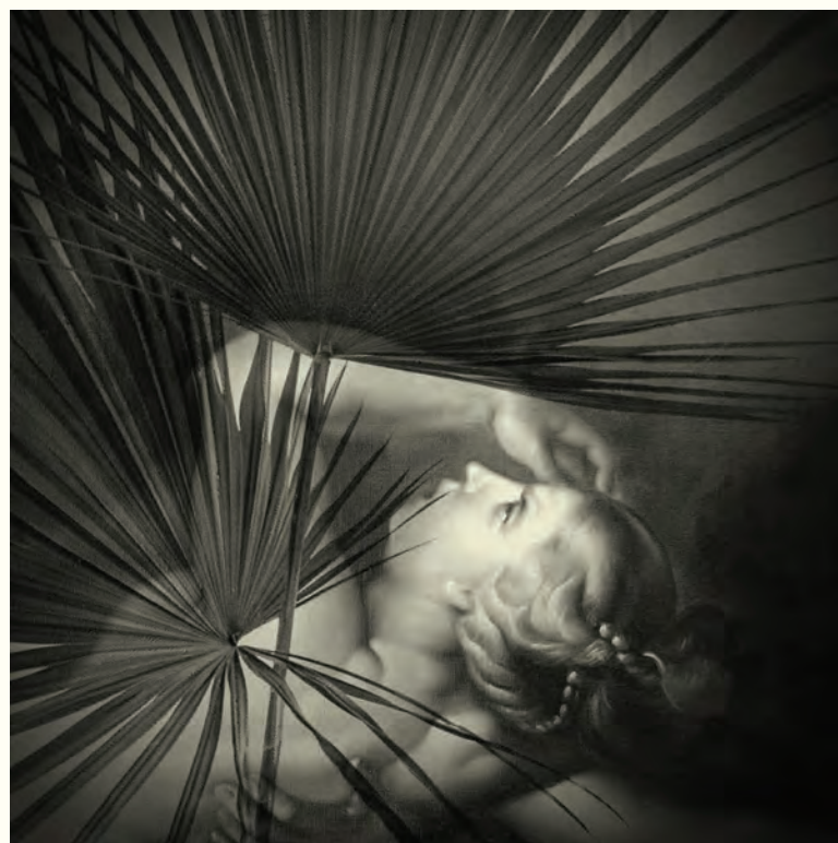
13. Una mirada vertical en los tiempos antiguos. Fotografía intervenida digital / Giclee print / 2024 / Lienzografía sobre fine art canvas 100% Algodón / 33.25" X 33.25"