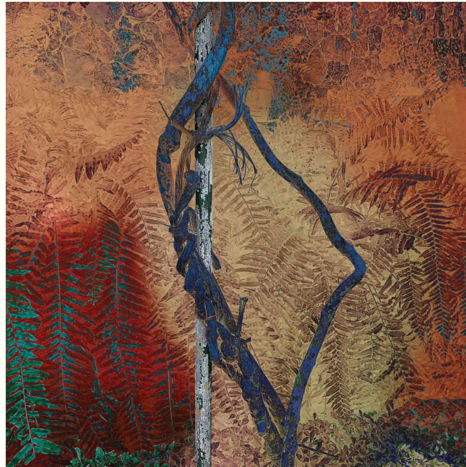
1. Orgánicos lúdicos de mi mente I. Fotografía intervenida digital / Giclee print / 2024 / Lienzografía sobre fine art canvas 100% Algodón / 33.25" X 33.25"

Ángel Ricardo Rivera / OCA | News / Director / Agosto, 2024