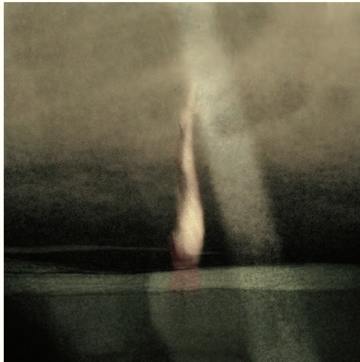
15. Diagonal de luz, muéstrame tu mirada en tu cruzada vertical Fotografía intervenida digital / Giclee print / 2024 / Lienzografía sobre fine art canvas 100 % algodón / 33.25" X 33.25" / Contra portada /

Por : Manuel Borja-Villel / Revista: Carta #5 / Museo Nacional Reina Sofía