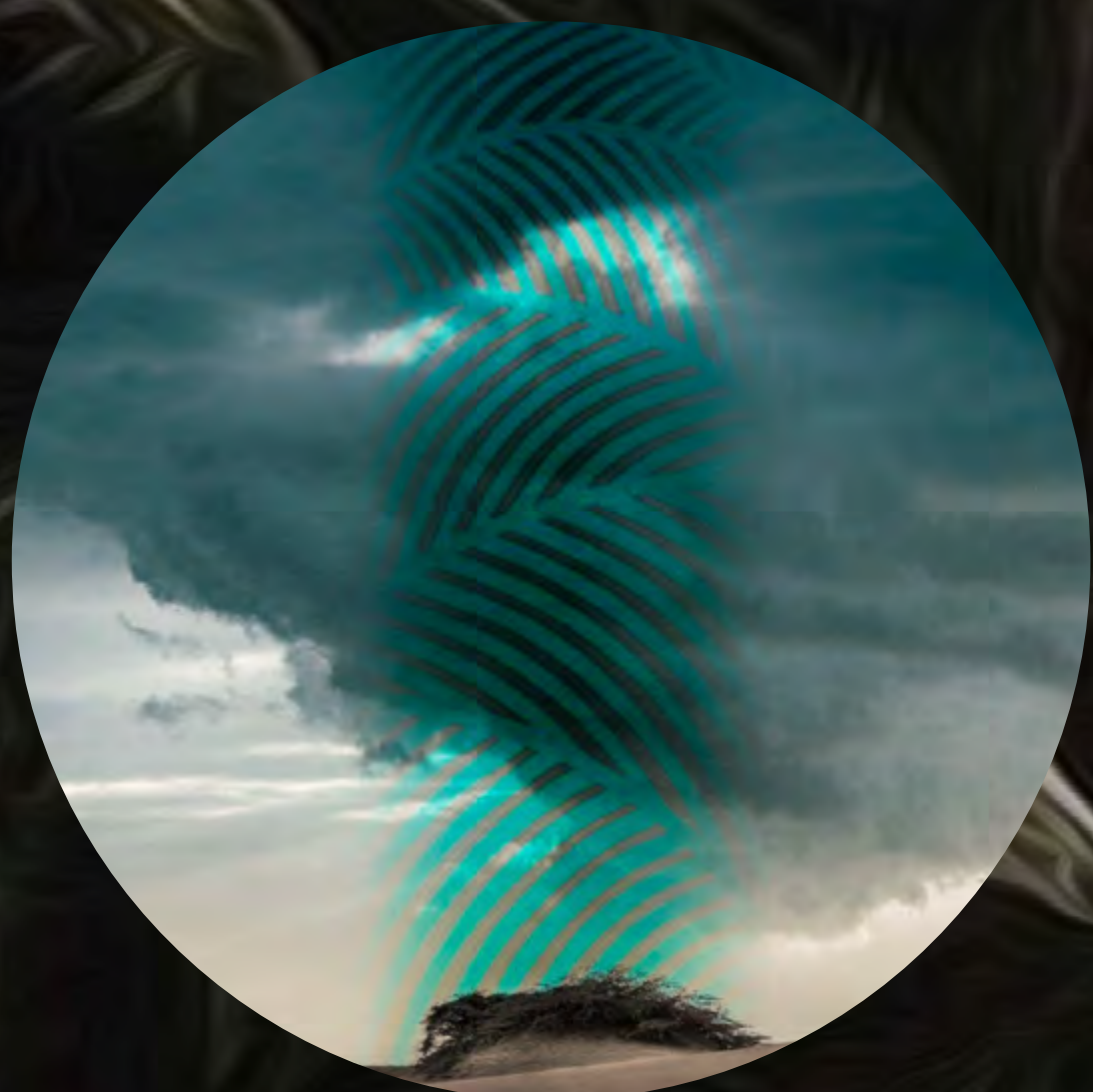
5. Sensualismo en las "Dunas" Fotografía intervenida digital / Gicleé print / 2022 Lienzografía sobre aluminio DiBond ACM 4mm. / 42.7" diámetro circular