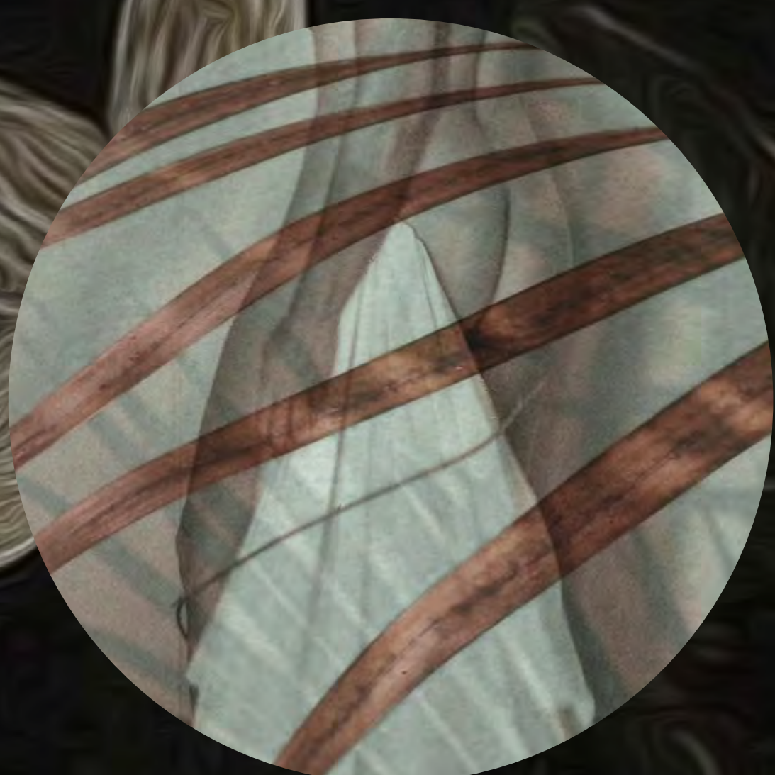
18. Detrás del telón de la poesía erótica Fotografía intervenida digital / Gicleé print / 2022 Lienzografía sobre aluminio DiBond ACM 4mm. / 42.7" diámetro circular