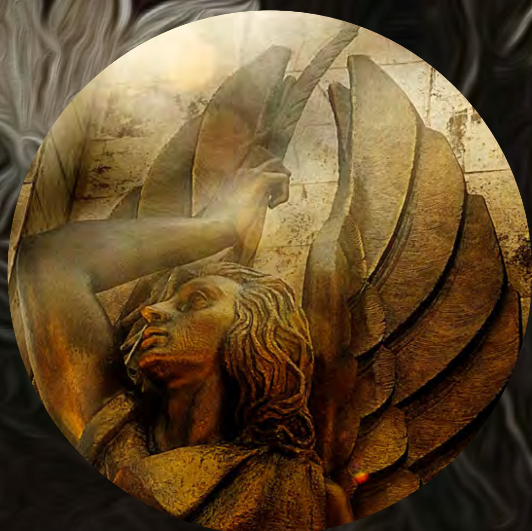
17. Esperando la música del aura Fotografía intervenida digital / Gicleé print / 2022 Lienzografía sobre aluminio DiBond ACM 4mm. / 42.7" diámetro circular